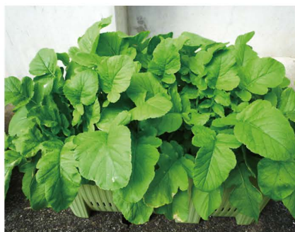
【プランターの野菜】