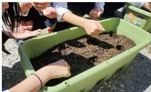
【ダイコンの種まき】

自分たちで考えたレシピを使った調理実習を行った。無農薬栽培のため安心して，皮や葉など使える部分は有効に使った。素材の良さを生かした調理法や素材の持っているおいしさに気付くことができた。