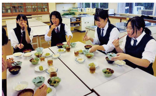
【間引き菜料理の試食】