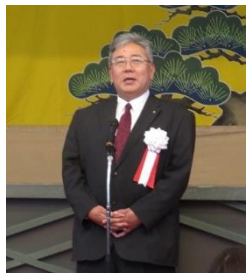
挨拶 徳島県教育長 美馬持仁