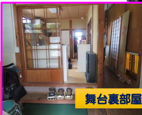
舞台裏部屋及び収納棚