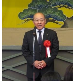
祝辞 徳島県議会副議長 岩丸正史