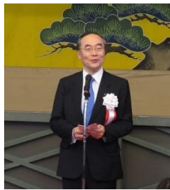
式辞 徳島県知事 飯泉嘉門