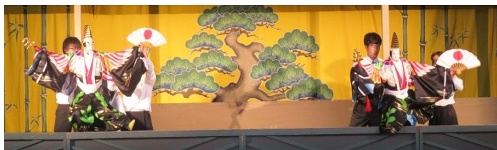
城北高校民芸部による「寿二人三番叟」を披露