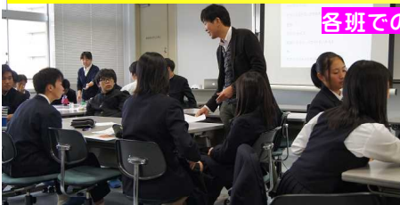
各班での話し合い

各班で前回考えたラベルデザインのコンセプトを元にライフスケッチ（デザインを簡単に鉛筆等で描いたもの）を行った。その後、提示されたものや各自スマホ等からの情報を探索しながら各班で話し合っていた。話し合いのポイントとして、文字（ひらがな・カタカナ・アルファベット）、書体、文字サイズ、写真にするかイラストを入れるかを考慮しながら、色・文字・イラストの配置等を話し合った